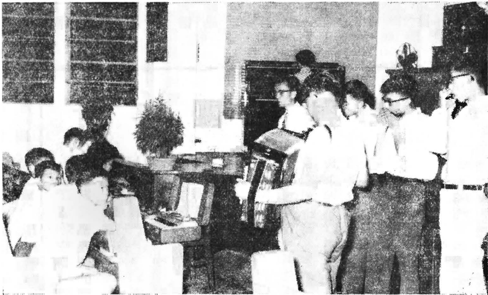
A Musical Ensemble.

友們可以彼此幫助靈性的進步，也同樣可以彼此幫助學業的進步，所以我說參加團契對於我們的學業是有益無損的。我們的團友們大多數都是學校裏的高材生，很多團友也都升入大學，由此我們更可以看出參加團契是不影響我們的學業的。